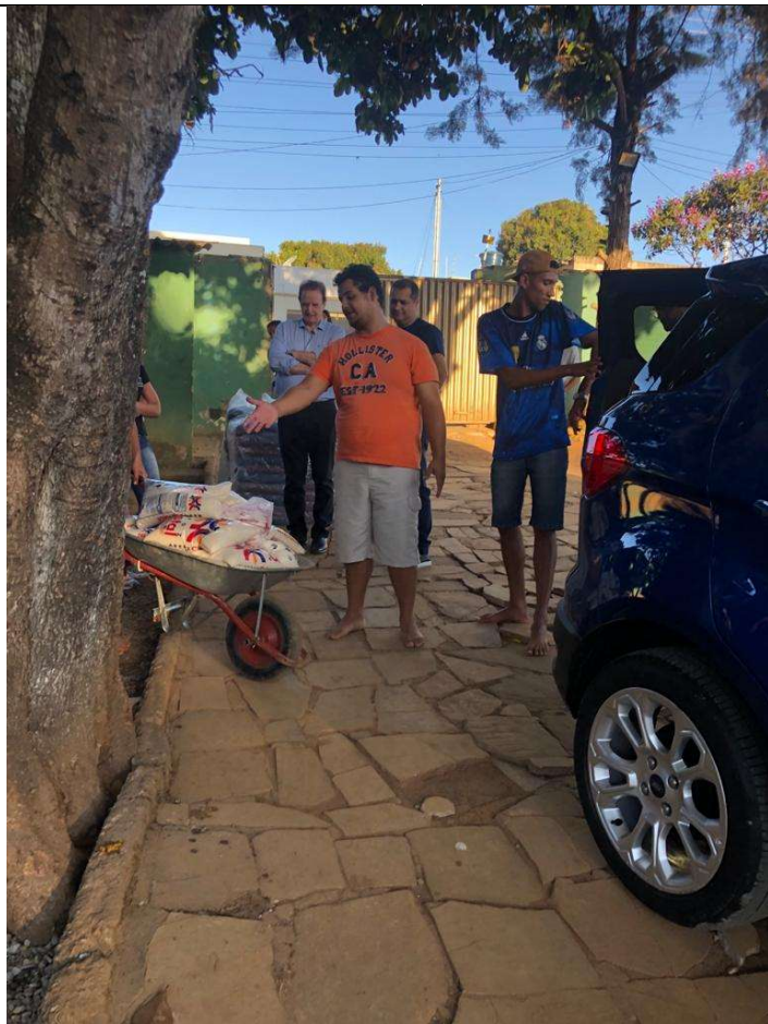
Doação de Alimentos