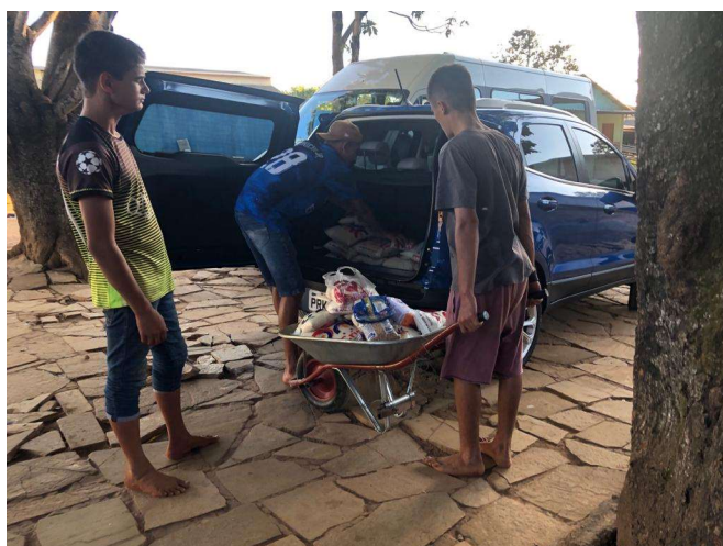
Doação de Cobertores e Alimentos