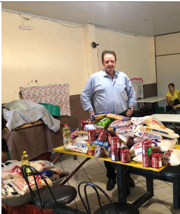
Doação de Alimentos