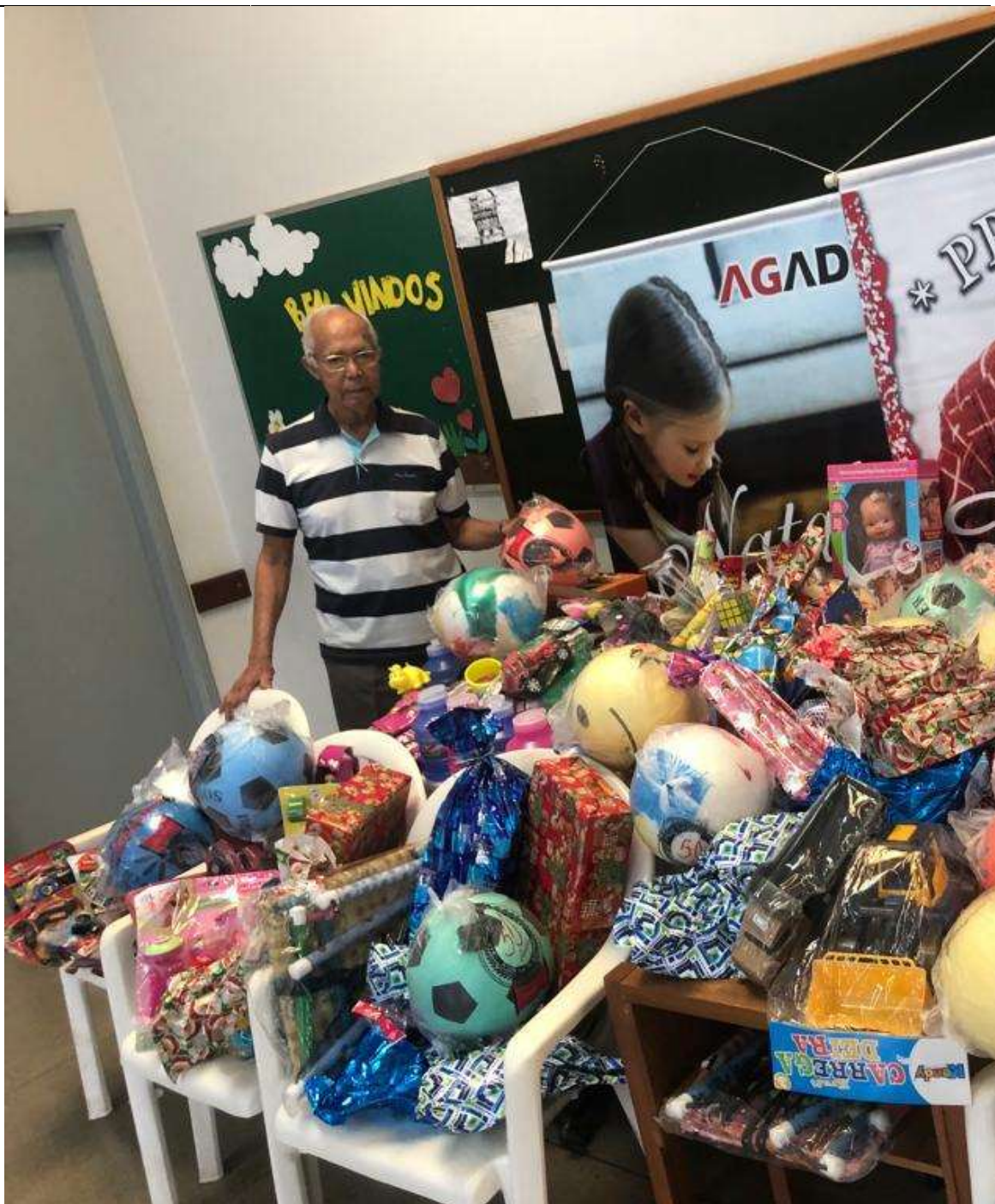
Doação de Brinquedos